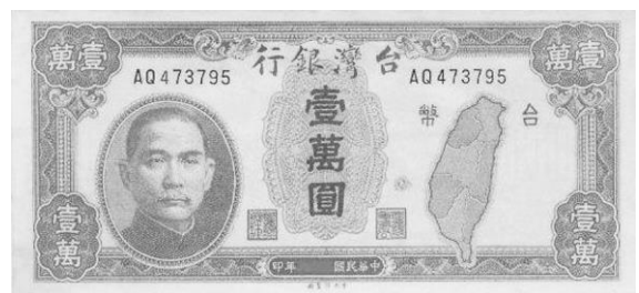
3. 圖中的舊臺幣反映出民國 37 年惡性通貨膨脹造成幣值下跌。